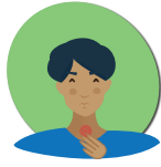
Mal de gorge