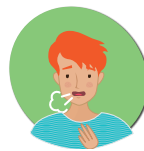
Shortness of Breath