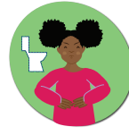
Vomissements ou diarrhée