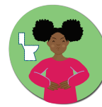
Vomiting / Diarrhea